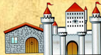
FERME et PARC DU CHÂTEAU