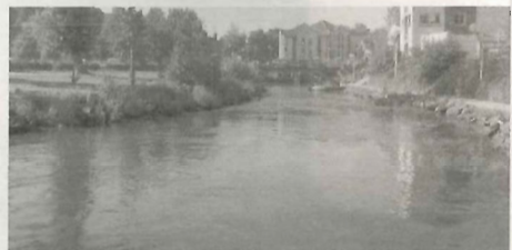
La Scarpe (photo d'illustration).