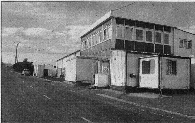
Le site Les Délices des 7 vallées implanté à Aubigny devient trop petit.

Pierre Guillemant, le président de la communauté de communes de l'Atrébatie avait le sourire. Le sourire de celui qui vient de réaliser un « gros » coup. Le sourire