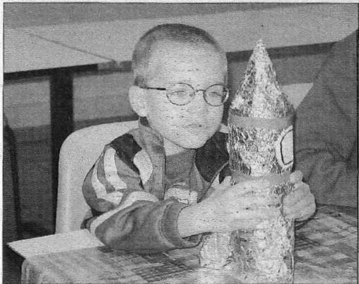
Les plus âgés ont pu fabriquer des jeux de quilles en forme de fusées.