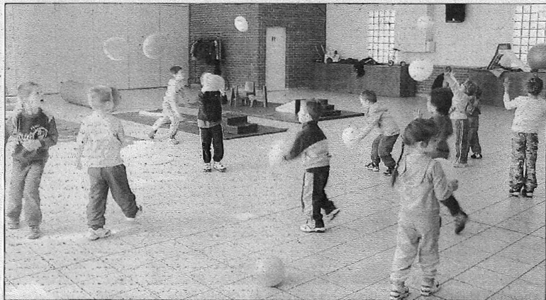
Les enfants de la com de com avaient rendez-vous à la salle d'Izel.