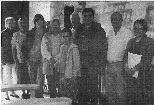
Experts et visiteurs ont partagé leur passion dans le cœur de l'église de Béthonsart.