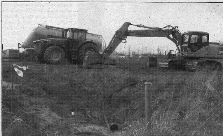
Les derniers travaux d'aménagement sont en cour sur le parc de Tincques.