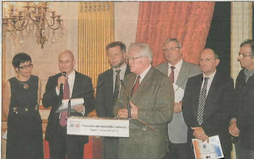
Sur 295 projets soumis, celui de Magnicourt-en-Comté fait partie des quinze retenus.

Cette réalisation atrébate commence désormais à être bien connue dans le secteur, où elle est appelée à faire des émules. Ce pourrait aussi être le cas désormais à