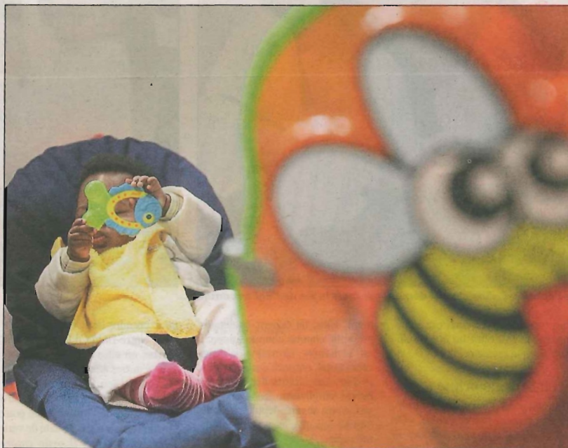
La crèche d'entreprise sera la première à voir le jour sur notre secteur.

En l'état actuel de la réflexion, la crèche est pensée pour accueillir treize enfants (âgés de 8 semaines à 4 ans) sur un espace de 137 m 2 , ceci 5 jours par semaine sur une large période de fonctionnement (a priori de 7 heures à 19 heures).